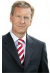
Aktueller Krawattenmann des Jahres: Christian Wulff